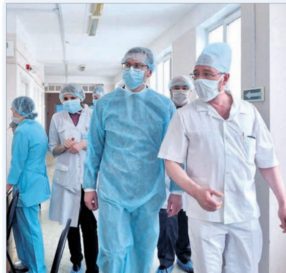
Врачи и медперсонал в инфекционных отделениях используют все возможные способы защиты от заболевания

— Когда мы узнали о реперофилеировании нашей больницы и что теперь весь медперсонал — это работники инфекционного отделения, конечно, у всех был ступор, — признаётся она. — Страх не за себя, а за своего ребёнка. Вдруг ты станешь переносчиком болезни? Муж и родители были в панике, говорили: «Увольняйся». Но об увольнении не могло идти и речи. Я приняла решение: раз такое положение, идём до конца. Слабым не место в медицине!