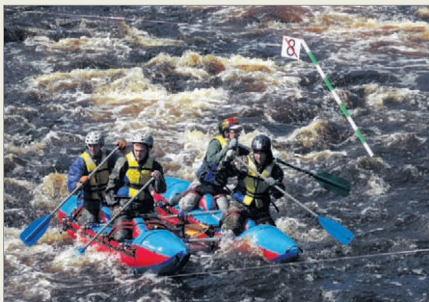
Сплав на катамаранах по реке Чёрная в 2019 году, посвящённый Дню Победы